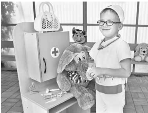
В «Ветклинике» дошколята печат плюшевых зверей