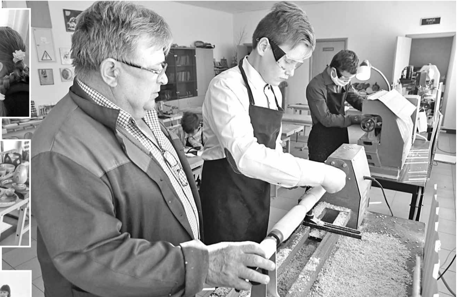
На уроке технологии в школьной мастерской

— С пятого класса я веду у ребят технологию, начинаем с самого простого — строгания древесины. После дерева постепенно переходим к работе