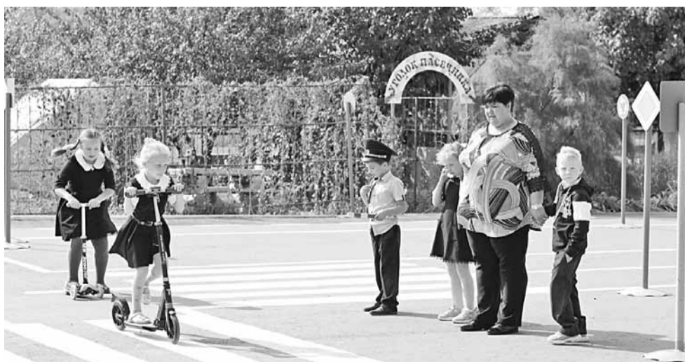
В «Автогородке» школьники на практике учат Правила дорожного движения